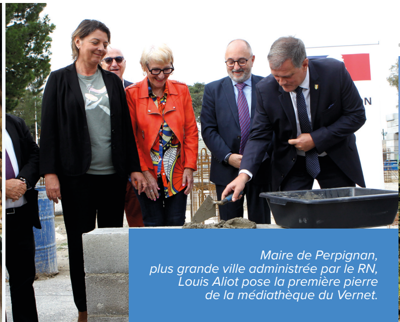
Maire de Perpignan, plus grande ville administrée par le RN, Louis Aliot pose la première pierre de la médiathèque du Vernet.

Les villes RN ne sont pas des villes que l'on fuit, mais où l'on revient, où on s'installe et où on fait le projet d'une vie, mais surtout où l'on vient de l'extérieur pour participer aux nombreux événements festifs.