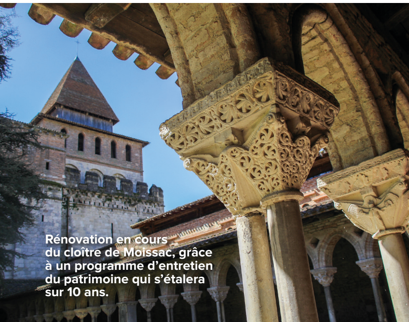
Rénovation en cours du cloître de Moissac, grâce à un programme d'entretien du patrimoine qui s'étalera sur 10 ans.

Les manifestations y sont revenues massivement, la culture y a été démocratisée quand elle était souvent confisquée, et les entreprises et commerçants ont trouvé avec nos élus des interlocuteurs pragmatiques, loin des logiques déifiantes à l'égard du monde économique.